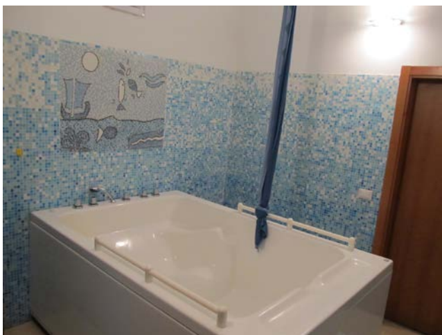
Parto in acqua