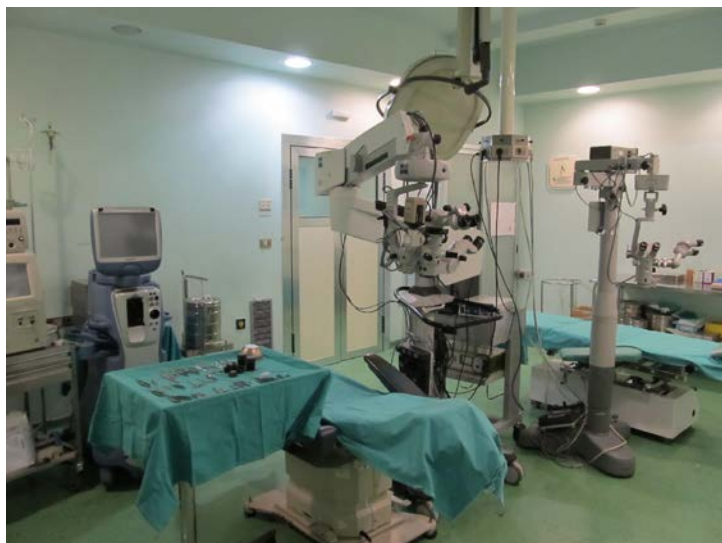
Sale Operatorie Oculistica